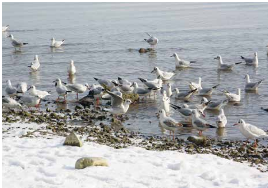
Möwen in der Salmsacher Bucht