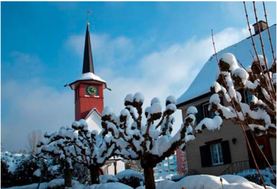
Salmsacher Kirche